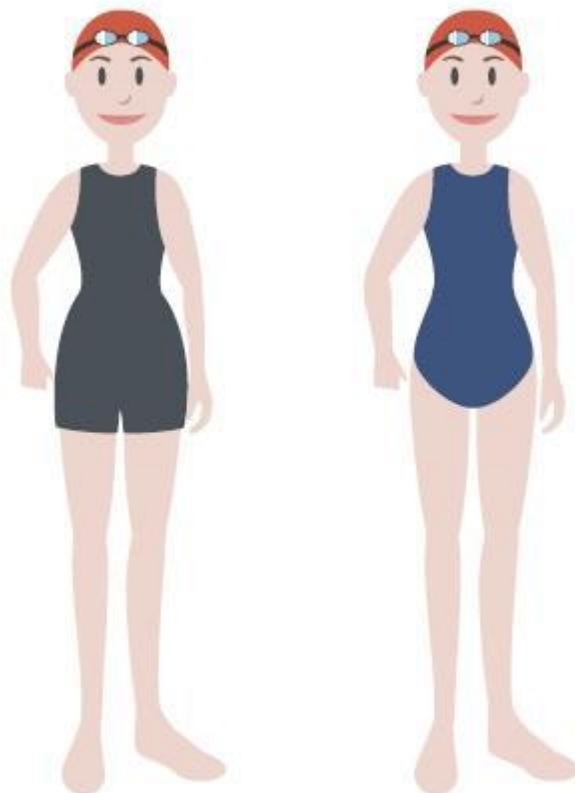
Figura 2 – Equipamentos de competição para as nadadoras infantis.